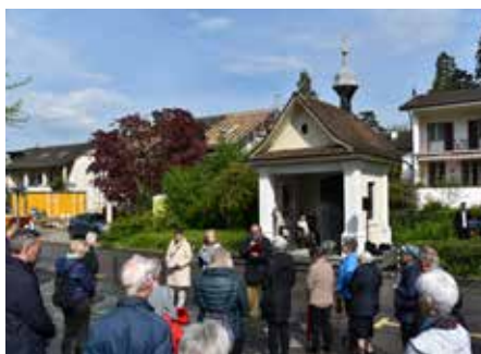
Impression des Musegger Umgangs im letzten Jahr