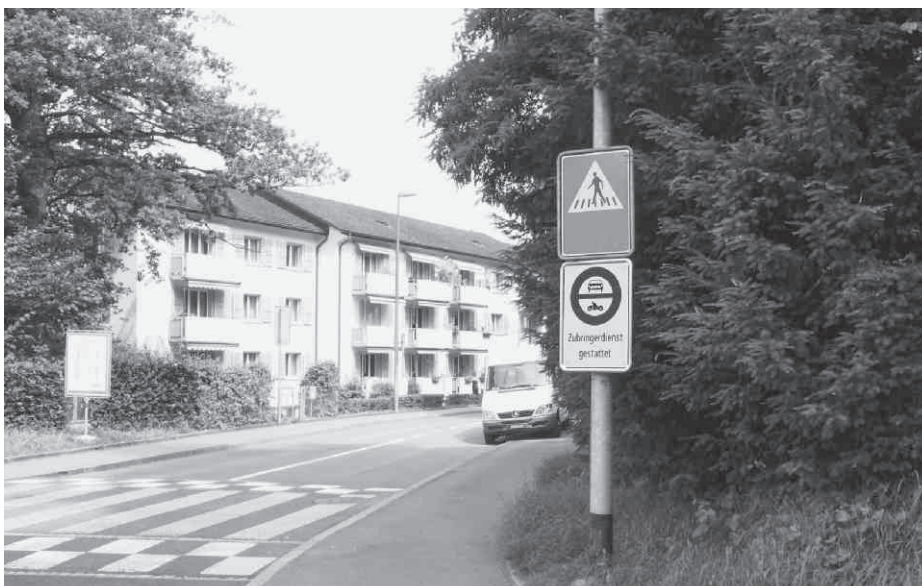
Zubringerdienst gestattet – nur Zubringerdienst.