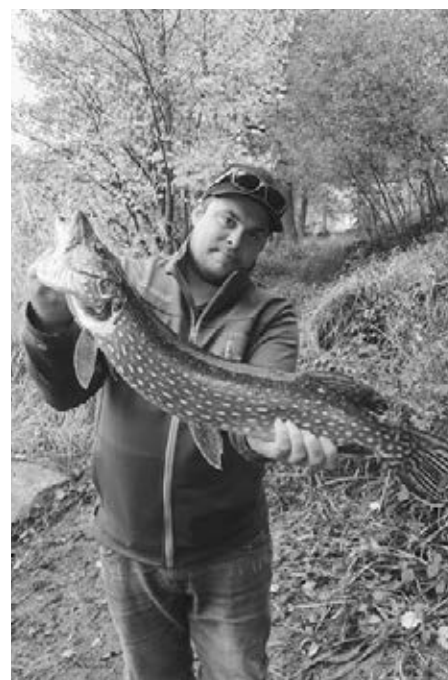
Sommerhecht am Rotsee

Die Phosphatkonzentration nahm gegenüber 2016 leicht zu. Sie liegt weit unter den Werten in den 60er Jahren, aber immer noch leicht höher als im Sempacher-, Hallwiler- oder Baldeggersee. Für den Fischbestand hat das einen positiven Effekt. Es hat genügend Nahrung für die Fische. Im letzten Jahr wurden 162 Hechte gefangen. Für die Grösse des Rotsees ein absoluter Topwert schweizweit. Aber auch die Vögel fühlen sich wohl am Rotsee. Eindrücklich zu sehen während der Wintermonate, wenn die Tafelenten und Reiherenten zu tausenden den Rotsee bevölkern, um zu überwintern. Dass es darunter auch fischfressende Vögel gibt, stört die Fische(r) nicht. Zu ausgewogen ist der Bestand an Fischen und Vögeln. Gerade deswegen ist ein verantwortungsvol-