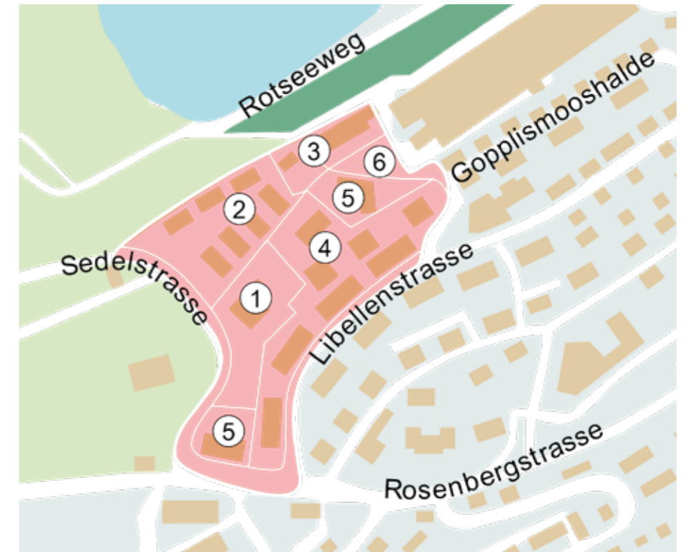
Bearbeitungsperimeter der Entwicklungsstudie