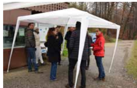
Im Gespräch mit Vertreterinnen und Vertretern des Vereins und Behörden