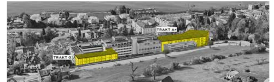
Die beiden neuen Trakte des Bauprojekts ANNAplus: Links der Erweiterungsbau Trakt G, rechts der Ersatzneubau Trakt A+

mit Aufwachraum und Zentralsterilisation, mehrere Pflegestationen sowie das Institut für Radiotherapie beheimatet sein. Der Trakt A+ wird voraussichtlich im Jahr 2027 eröffnet.