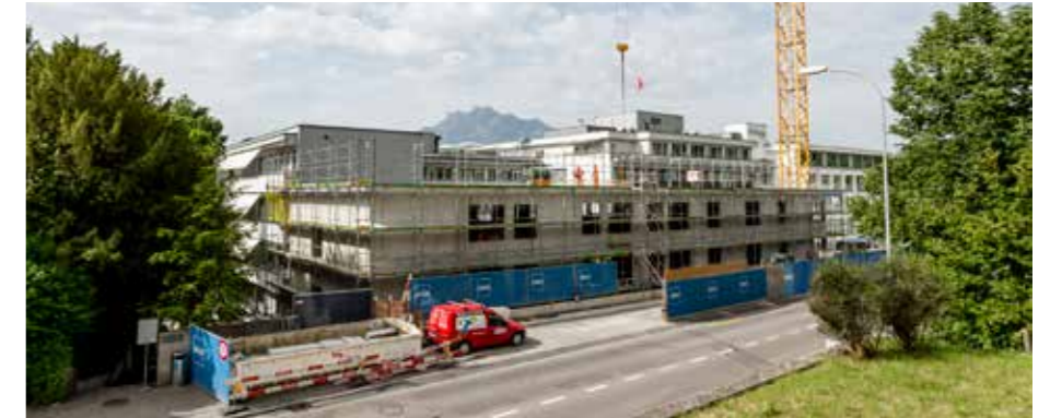
Mai 2022: Der Rohbau des Erweiterungsbaus Trakt G ist errichtet

Für die weiteren Bauetappen (siehe Kasten) sind momentan noch viele Planungsarbeiten im Gang. Unter anderem ist der Rückbau der heutigen Trakte A und B vorgesehen. Diese Gebäudeteile stammen teilweise noch aus der Gründerzeit der Klinik und müssen ersetzt werden. An deren Stelle tritt der Ersatzneubau A+, das neue Herz des zukünftigen Klinikbetriebs. Hier werden unter anderem das neue Notfallzentrum, neun Operationssäle