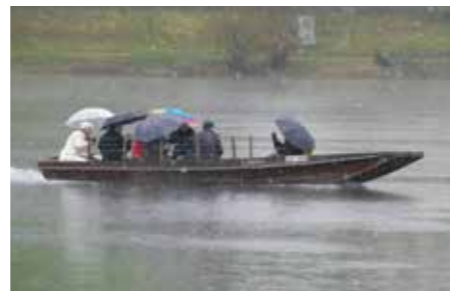
Trotz Regen und Schnee liessen sich Einige von einer Seefahrt nicht abhalten