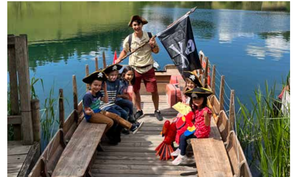
Die gefährlichen Piratinnen und Piraten auf der Fähre

Also fuhr ich wieder zurück. Die Piraten waren jetzt friedlich, weil sie wussten, wo sie weitersuchen mussten. Sie bezahlten sogar das Billett für die Fähre, einen Franken für die kleinen Piraten und drei Franken für den grossen Piraten.