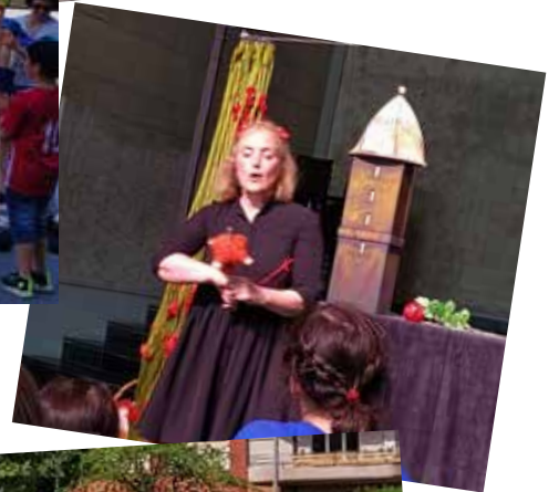
Der Maihof stand Kopf am 15. Mai