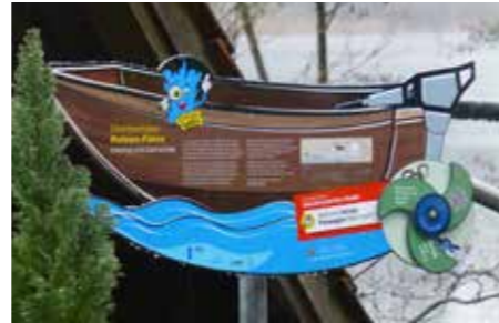
Der Energito, das Maskottchen der EnergieTatOrte, der genau hinschaut! Seine Frisur erinnert in kreativer und witziger Weise ans Energiestadt-Logo!