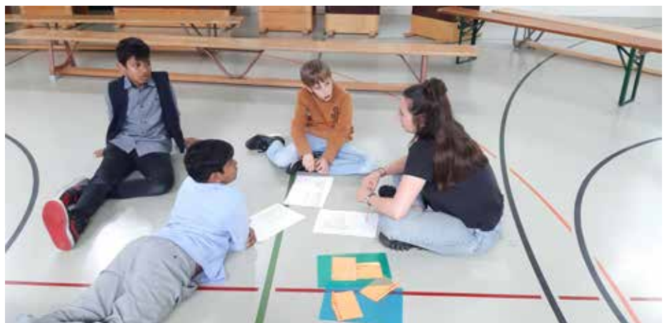
Kurz vor dem Anlass besprechen wir nochmals den Ablauf