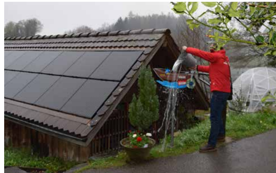
Die Taufe mit Seewasser