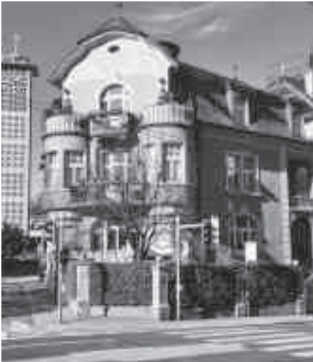
Das Maihüsli an der Maihofstrasse 44