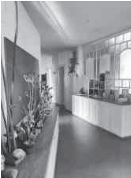
Schöne Räume, in denen man herrlich spielen kann.