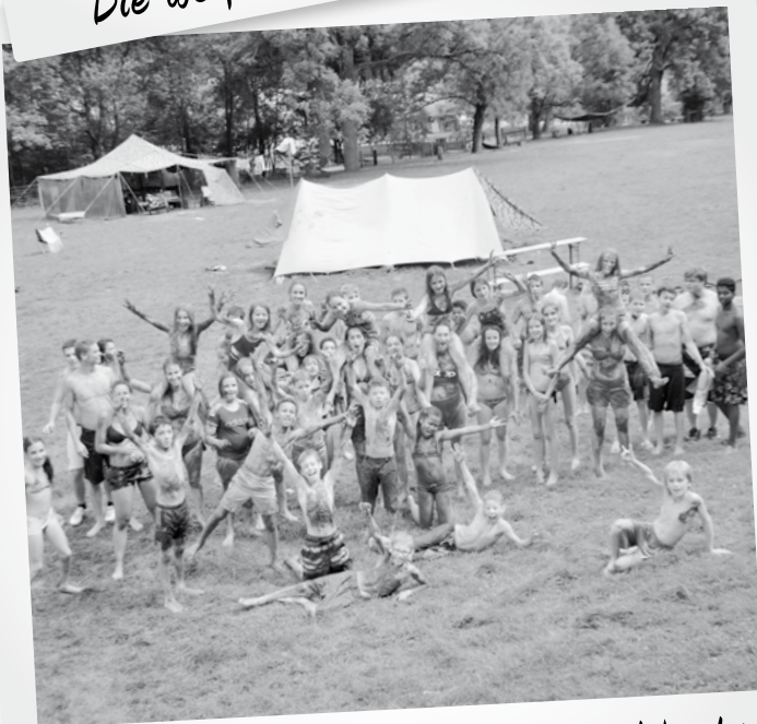
... nach einer tollen Wasserschlacht