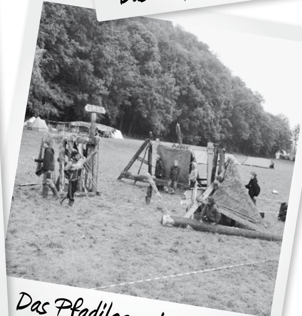
Das Pfadilager in Büsserach