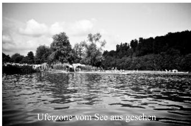
Uferzone vom See aus gesehen

Ferner ist vorgesehen, auch die Wege, Plätze und Uferzonen zwischen Rotseewiese und Zielgelände aufzuwerten.