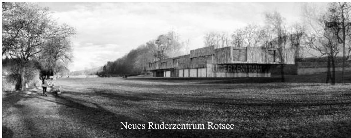
Neues Ruderzentrum Rotsee

In der Naturarena Rotsee sollen bis 2016 der Zielturm und das Ruderzentrum erneuert werden.