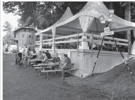
Das «Rotsee-Beizli» lädt zum Verweilen ein

Bereits zum 5. Mal in Folge wird dieses Jahr das «Rotsee-Beizli» an seinem bewährten Standort für Sie an folgenden Wochenenden offen sein: