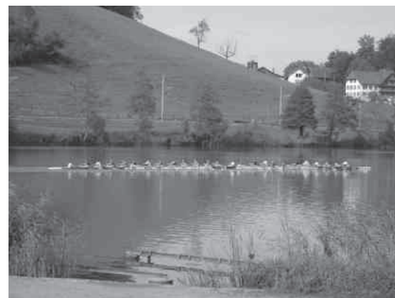
24er-Boot des «RCR» auf dem Rotsee

Die Speise- und Getränkekarte ist traditionell gut und international geschätzt.