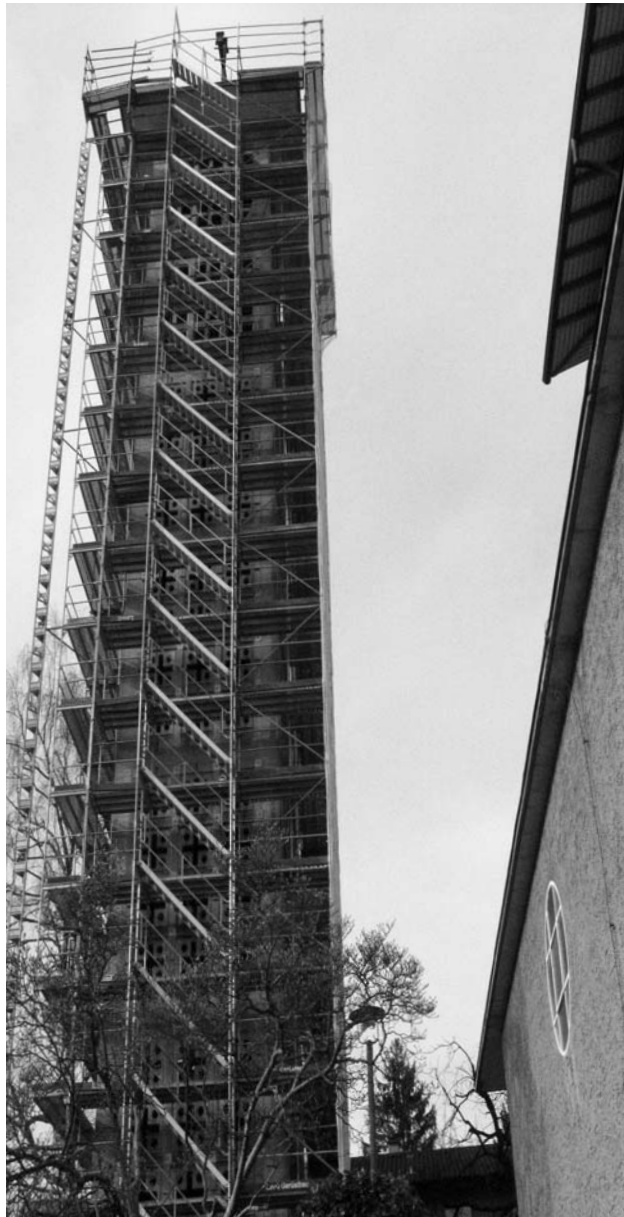
Turmgerüst am Maihofkirchturm